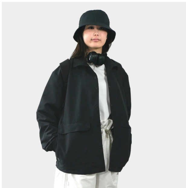
コーチジャケット 女性着用（身長 164cm / L サイズ）