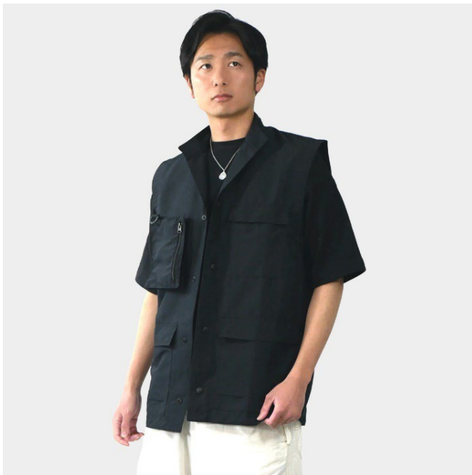
カーゴベスト 男性着用（身長 176cm / Lサイズ）