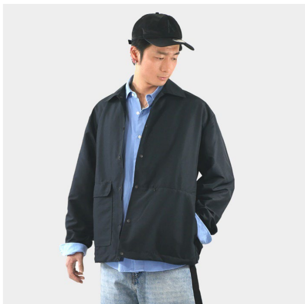
コーチジャケット 男性着用（身長 176cm / LL サイズ）