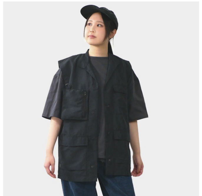
カーゴベスト 女性着用（身長 164cm / Mサイズ）